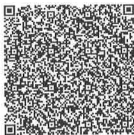
培训钉钉群二维码

本次学习的报名咨询、线下培训直播、学习交流、证书发放和发票等均在钉钉群内沟通，请缴费成功的各位师资下载手机钉钉 APP，实名注册后扫描以下二维码加入钉钉群。